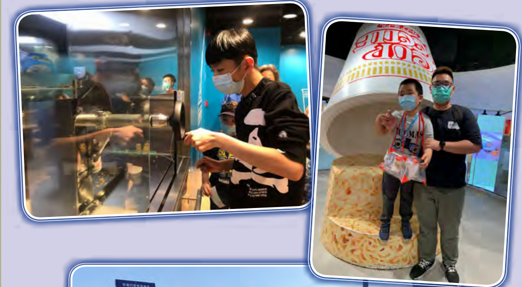
特別感謝積極參與的黃金花義工們當日與我們同行

我們與匡智元朗晨樂學校合辦今次活動，與一眾晨樂學校的照顧者、學生及智親至愛義工一同暢遊瀟瀟仙館、合味道紀念館及星光大道。參加者在合味道紀念館製作獨一無二的杯麵之餘，亦拍攝了很多「打咗相」。在活動期間，照顧者及義工彼此作出交流及互相鼓勵。