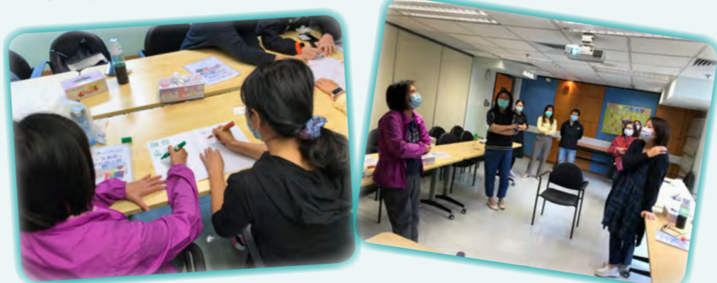
參加者分享「死亡」帶給他們的聯想及自己與「死亡」的距離。

◇另外，亦於11-12月期間，到匡智屯門晨職學校舉辦生命教育小組，與照顧者一同談生論死。過程中雖然有眼淚，但更叫我們學習把握現在，愛要及時。