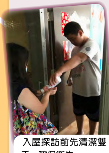
入屋探訪前清潔雙手，確保衛生

◇智親至愛於今年5月份把握疫情緩和的時間，組織了社區義工(黃金花和恩福義工)及照顧者義工共30人，舉行了「智愛·幫你買」義工探訪活動，為受疫情影響、需要長期在家照顧子女及年老而未能外出的照顧者，協助購買生活及防疫物資，以紓緩照顧者在疫情下的生活壓力。除了協助購買物資，更希望透過上門探訪，為照顧者送上關懷，彼此在「疫」境打氣！