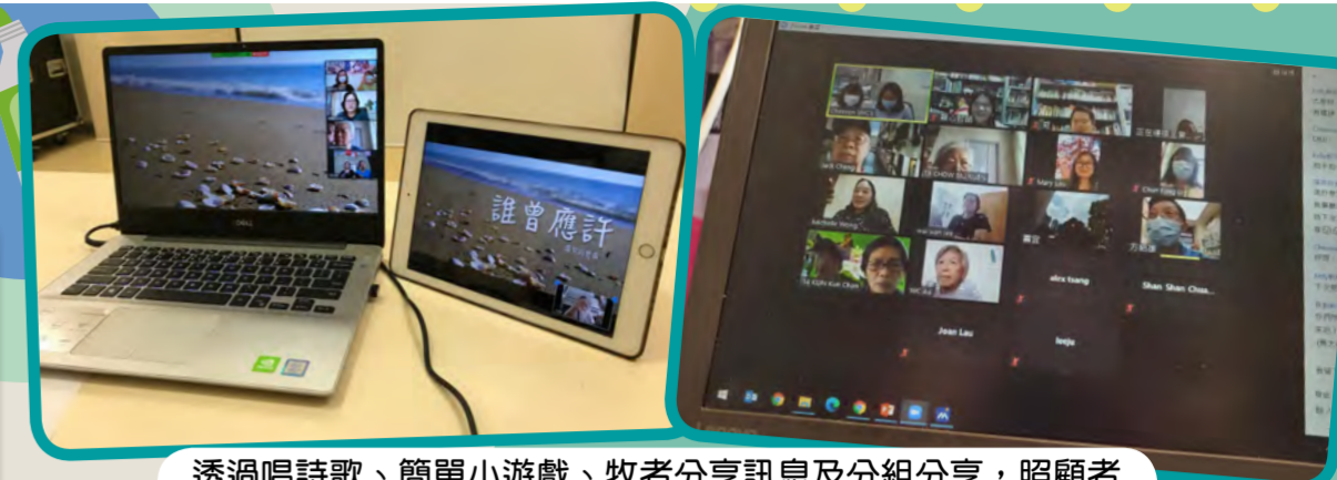
透過唱詩歌、簡單小遊戲、牧者分享訊息及分組分享，照顧者和義工都十分投入參與，互相分享近況和代禱。

智親至愛於2020年5-11月期間，舉辦了兩次網上聚會。8月份的主題為「愈難愈愛」，而10月份的主題為「愛相連」。雖然疫情令我們不能實體見面，但在困難裡亦無阻我們彼此相愛，在天父的愛裡互相連結。