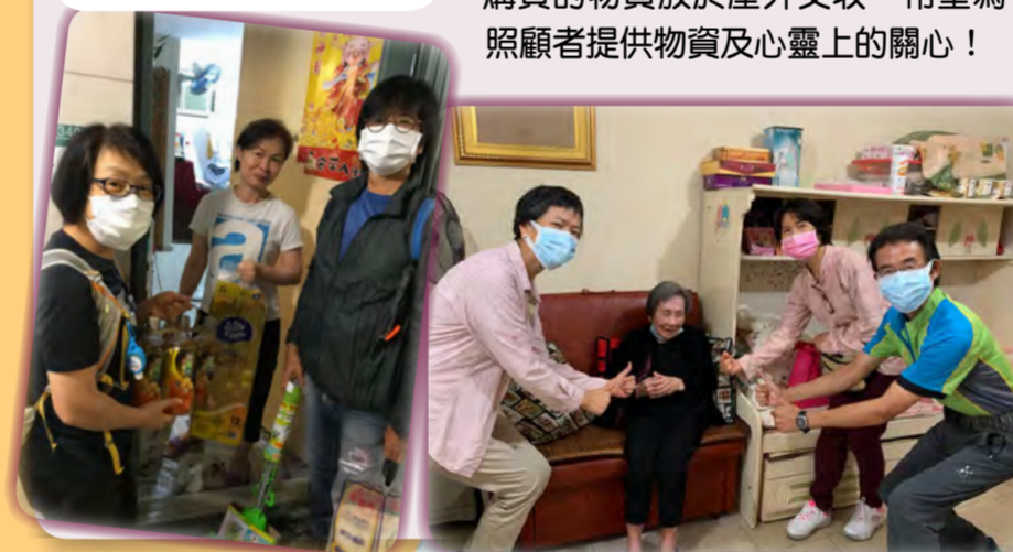
除了物資上的支援，更重要是向照顧者表達關心和打氣！

◇是次活動共探訪了15個家庭，探訪前後，義工均會用消毒酒精搓手液清潔雙手，並會於探訪期間戴上外科手術口罩，義工和照顧者的配對上亦盡量安排於同區內探訪，減少因乘搭交通工具而增加感染風險，確保整個探訪過程衛生又安心。如照顧者因疫情未能入屋探訪，義工更會將所購買的物資放於屋外交收，希望為照顧者提供物資及心靈上的關心！