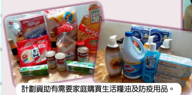
計劃資助有需要家庭購買生活糧油及防疫用品。

◇有申請家庭表示，隨著第三波疫情爆發，他們的家庭經濟需要變得更急切，有關資助能有效幫助他們以解燃眉之急，亦能在疫情下減輕負擔。